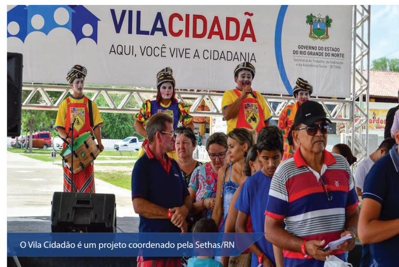
O Vila Cidadã é um projeto coordenado pela Sethas/RN