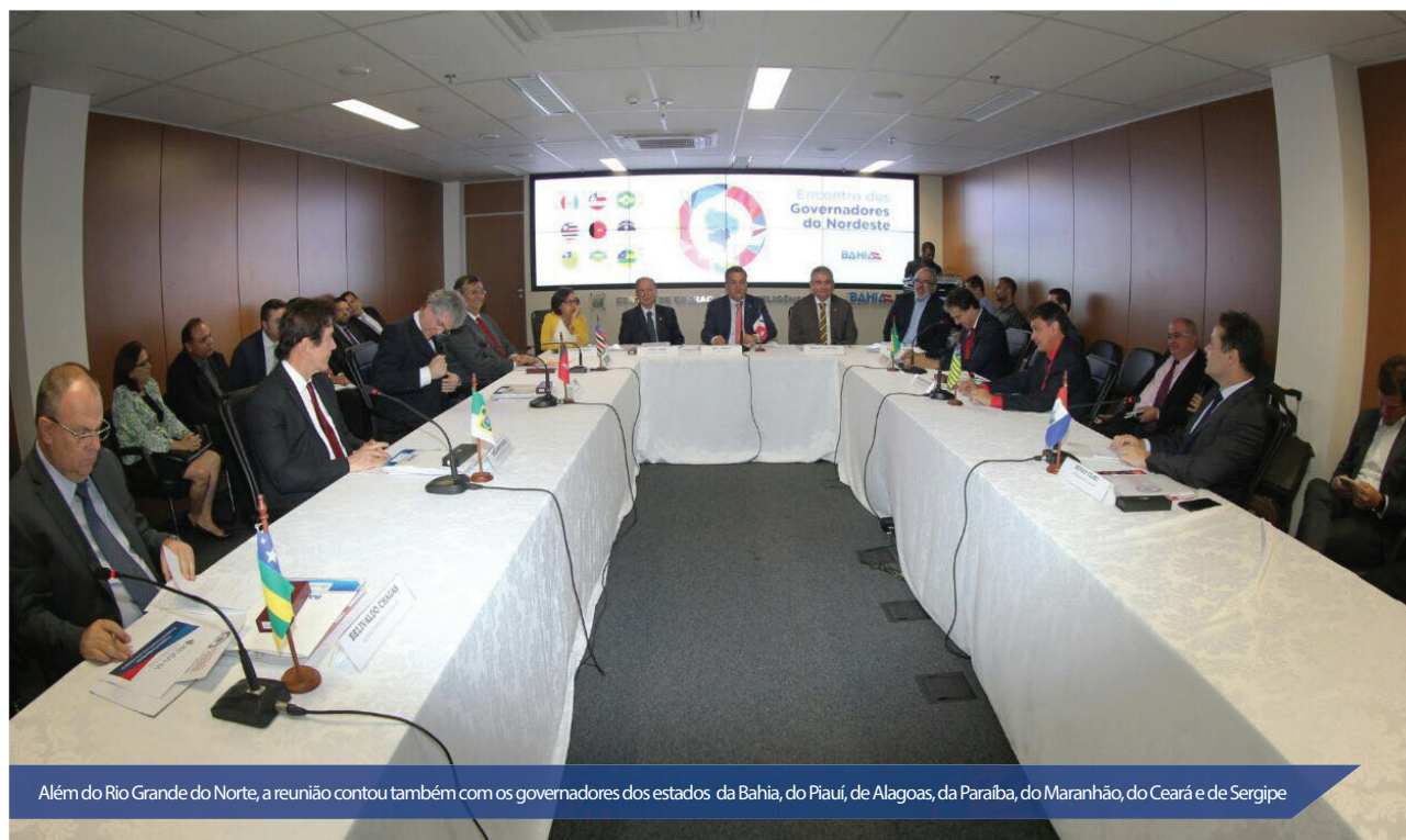
Além do Rio Grande do Norte, a reunião contou também com os governadores dos estados da Bahia, do Piauí, de Alagoas, da Paraíba, do Maranhão, do Ceará e de Sergipe

O encontro teve como objetivo discutir assuntos que, com o apoio do Governo Federal, beneficiarão todos os estados da região