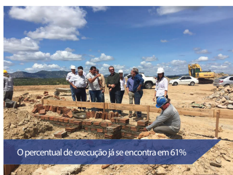
O percentual de execução já se encontra em 61%